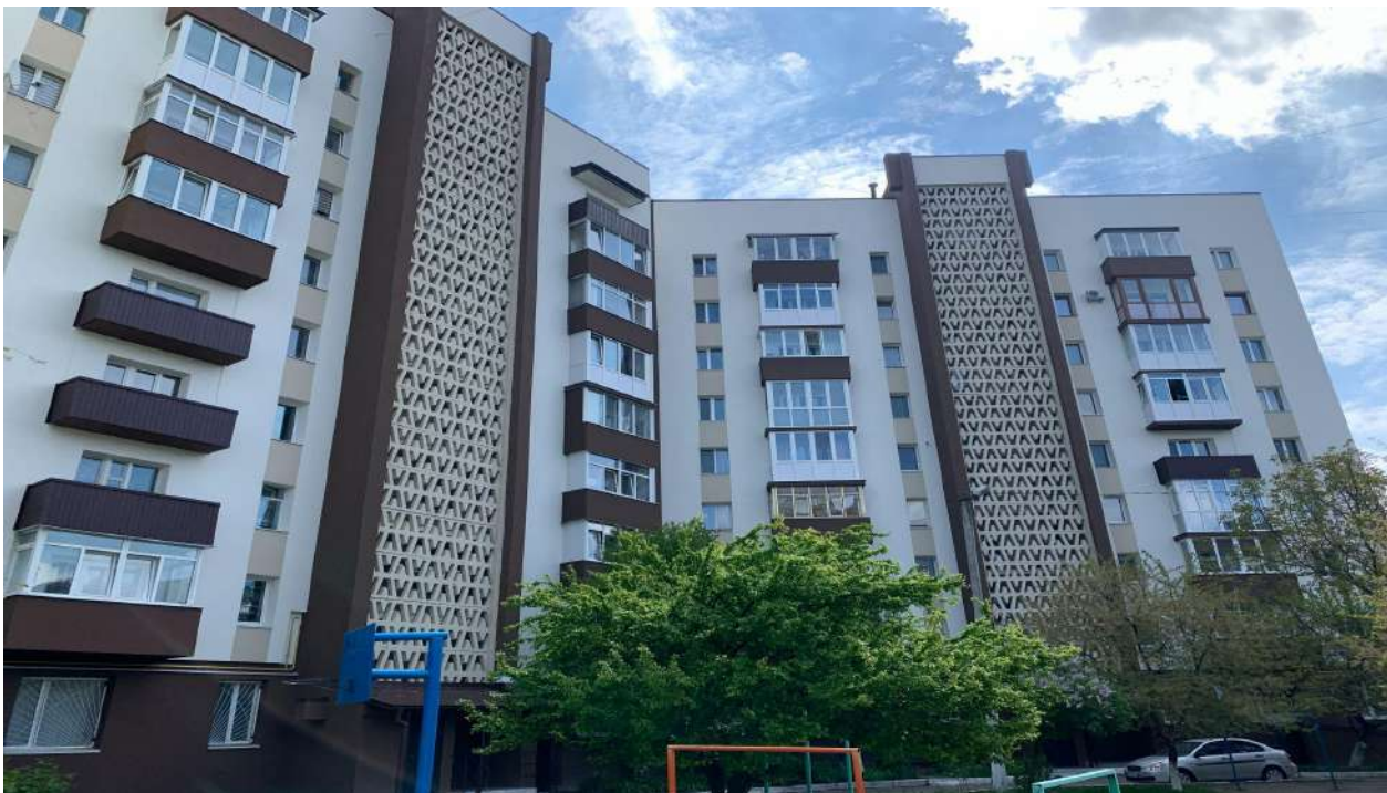
Фото 1 та фото 2 Роботи з утеплення зовнішніх стін, заміна вікон та дверей, балансування системи опалення з утепленням труб, заміна труб гарячого водопостачання з їх утепленням житлового будинку № 40 по вул. В. Чорновола в м. Рівне