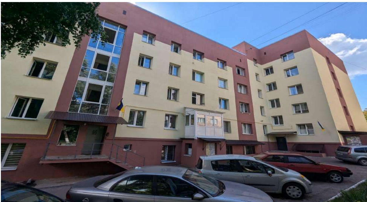
Фото 3 Термомодернізація житлового будинку (гуртожитку) №42 по вул. Кулика і Гудачека в м. Рівне.

У зв'язку із завершенням терміну дії Програми розроблено нову програму на 2025 – 2027 роки (рішення Рівненської міської ради від 24.12.2024 № 5900).