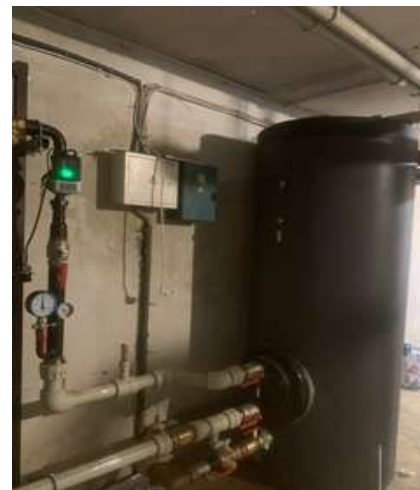
Фото 7, 8, 9 Влаштування теплового насосу

- на реалізацію проєкту «Реконструкція системи електропостачання шляхом встановлення сонячної електростанції на покрівлі Комунального некомерційного підприємства «Міська лікарня № 2» Рівненської міської ради за адресою: м. Рівне, вул. О. Олеся, 13», що фінансувався Благодійною організацією «Фонд «Енергетична Дія для України» та Департаментом