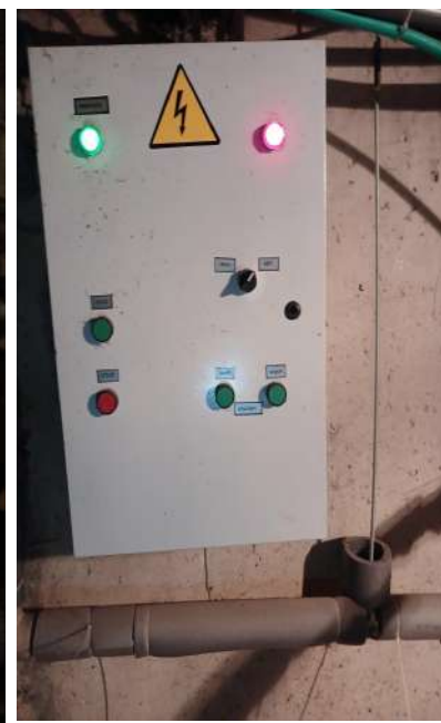
Фото 4 Протипожежні заходи. Фото 5 Інженерні мережі. Фото 6 Влаштування ІТП.