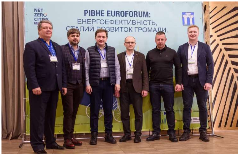
Фото 13*

Представники Департаменту спільно з Асоціацією легкої промисловості здійснили організацію та проведення Акції «Обирай, підтримуй, купи Рівненське», яка відбулась 25 серпня 2024 року у Парку Молоді («Лебединка»). Під час Акції відбулось багато різноманітних подій, а саме: виставка-продаж від понад 25 локальних рівненських виробників та бізнесів легкої та харчової промисловості, де майстер-класи для дітей та дорослих, панельні дискусії на важливі теми бізнесу, виступи спікерів, благодійні розіграші подарунків від партнерів заходу, фудкорт від місцевих виробників та закладів.