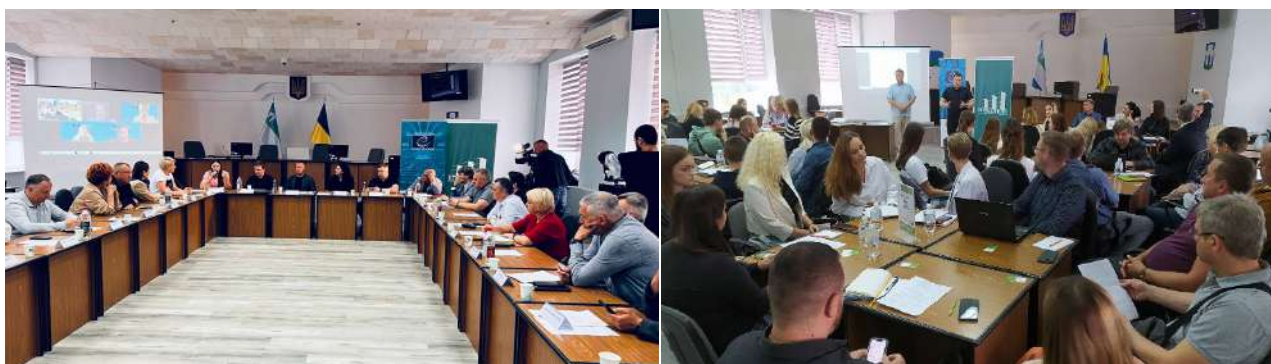
Фото 18

Розробка Стратегії розвитку Рівненської міської територіальної громади на період до 2028 року. За сприяння експертів проєкту Ради Європи «Зміцнення стійкості демократичних процесів через громадську участь під час війни та післявоєнний період» Рівненська міська рада з квітня 2024 року долучилась до розробки/оновлення Стратегії розвитку Рівненської територіальної громади на період до 2028 року (далі – Стратегія). Протягом травня-листопада 2024 року в громаді тривала робота з розробки/оновлення Стратегії. В грудні 2024 року оновлений проєкт документу представлений членам Стратегічного комітету з розробки Стратегії. Після доопрацювання заходів, документ планується винести на розгляд Рівненської міської ради для подальшого його затвердження.