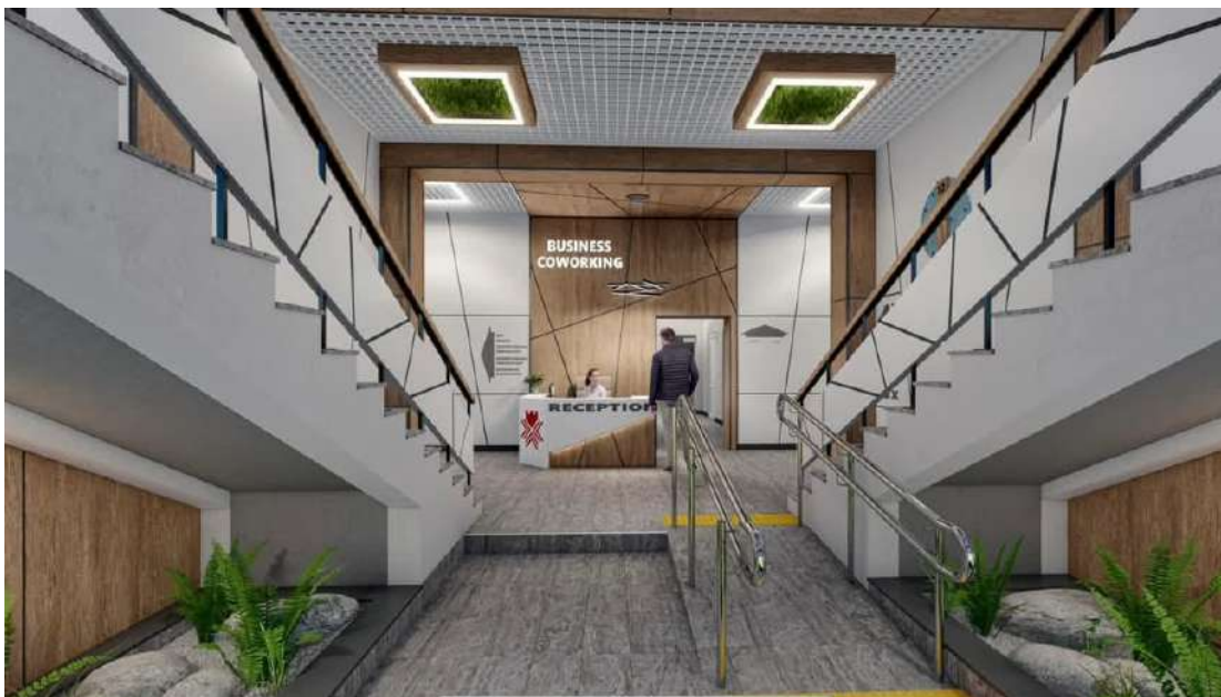
Фото 16

Згідно з додатковою угодою 5, укладеною між ПРООН та Рівненською міською радою, термін реалізації проєкту продовжено до березня 2025 року. Рішенням Рівненської міської ради від 24 грудня 2024 року № 5897 продовжено дію Програми залучення коштів для фінансування проєктів та заходів з розвитку Рівненської міської територіальної громади на 2025 рік.