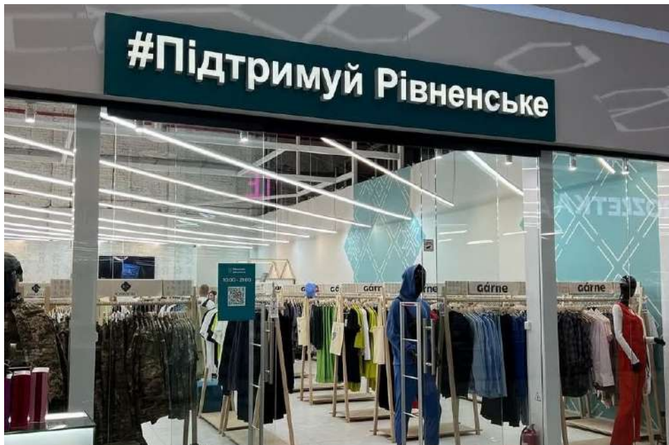
Фото 12*

Представники Департаменту забезпечили організацію та проведення «Круглого столу з питань започаткування або розвитку малого та середнього бізнесу в м. Рівне шляхом державної грантової підтримки», який відбувся 13 лютого 2024 року за участі представників громадських організацій, суб'єктів підприємницької діяльності, представників депутатського корпусу, студентів навчальних закладів та інших учасників.