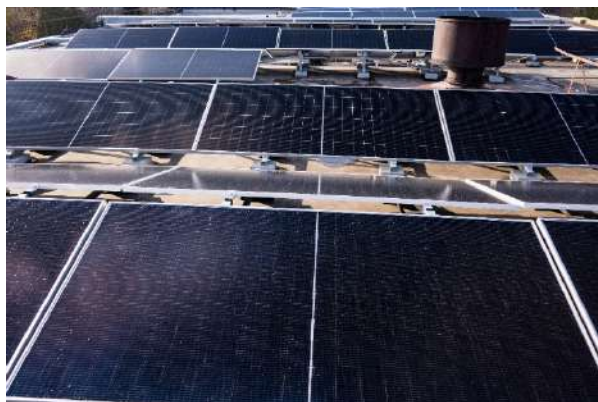
Фото 10, 11 Встановлення сонячної електростанції.

Протягом 2024 року здійснювалась реалізація проекту NetZeroCities , що передбачає створення концепції «Бачення нуль викидів для міста Рівного».