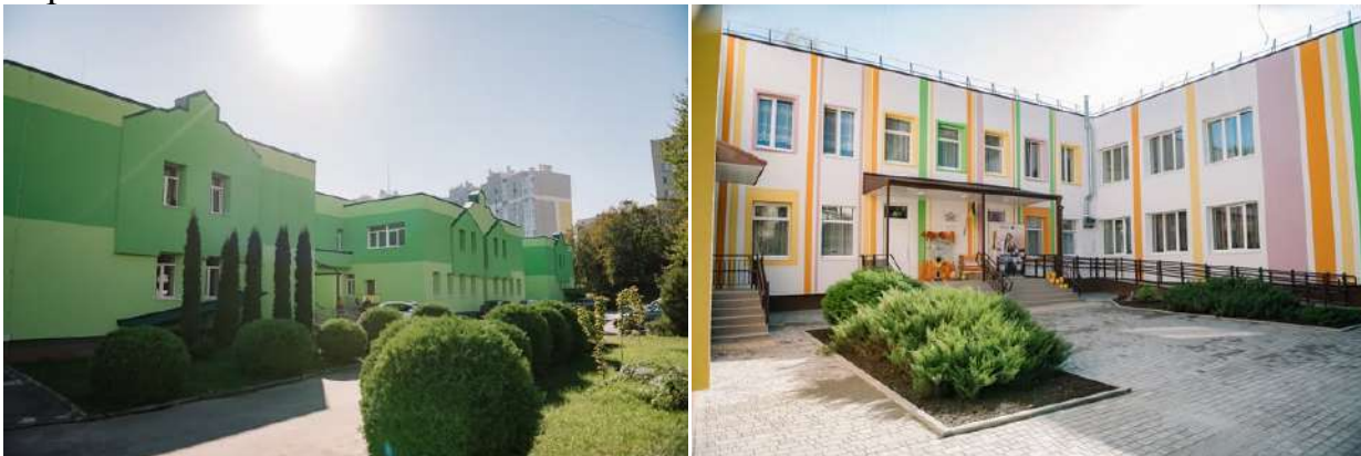
Фото 17*

Після впровадження енергозберігаючих заходів очікується економія споживання теплової енергії на понад 40% та електроенергії понад 30% порівняно з базовим споживанням.