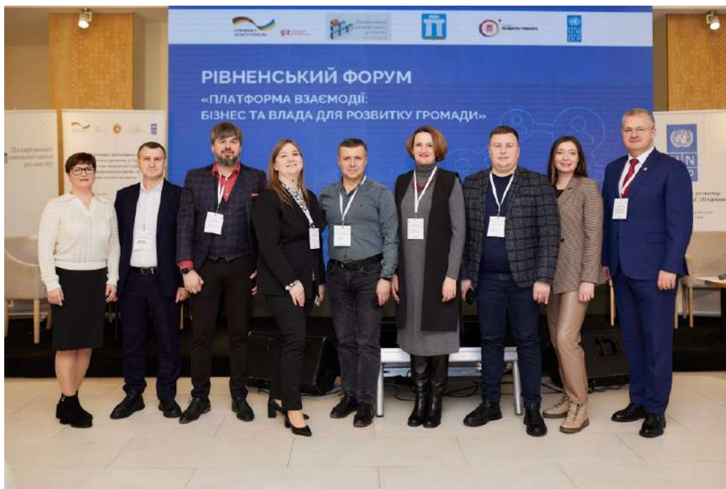
Фото 15*

13 грудня 2024 року Департамент економічного розвитку Рівненської міської ради спільно з комунальною установою «Агенція розвитку Рівного» Рівненської міської ради та Програмою розвитку ООН в Україні організували Рівненський форум «Платформа взаємодії: бізнес та влада для розвитку громади», присвячений обговоренню нових механізмів взаємодії бізнес-спільнот, місцевого бізнесу з Рівненським муніципалітетом і його структурними підрозділами задля сталого розвитку громади. Учасниками заходу були представники органів місцевого самоврядування, малого та середнього бізнесу, в тому числі ветеранського та релокованого, експерти з питань розвитку бізнесу, команди впровадження проекту SRER з партнерських міст Луцька, Вінниці та Тернополя. Головною метою заходу було обговорення нових механізмів взаємодії бізнес-асоціацій, кластерів з органами місцевого самоврядування задля сталого розвитку громади. Важливою подією на заході стало підписання меморандуму про співпрацю між Рівненською міською радою та Громадською спілкою «Рівненський харчовий кластер».