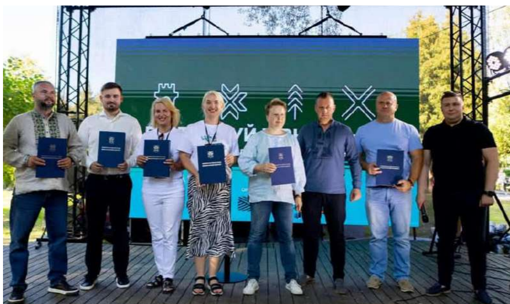
Фото 14*

Під час проведення Акції відбулось підписання меморандумів про співпрацю між Рівненською міською радою та 7 бізнес об'єднаннями бізнесу для посилення муніципальної підтримки місцевого бізнесу та допомоги у впровадженні визначених заходів з розвитку мікро, малого й середнього підприємництва.