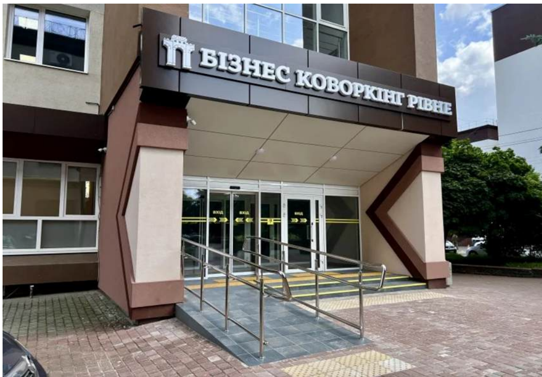
Фото 5* Реконструкція адміністративної будівлі за адресою: вул. Поштова, 2, м. Рівне.

Особливу увагу в межах реалізації проєкту приділено усуненню фізичних бар'єрів та забезпеченню рівного доступу до простору: встановлено ліфти, облаштовано безбар'єрну входну групу, адаптовано внутрішні приміщення з урахуванням потреб маломобільних груп населення, осіб з інвалідністю, людей старшого віку та батьків з дітьми. Реалізовані рішення відповідають принципам універсального дизайну та сприяють самостійному, безпечному й комфортному користуванню простором усіма відвідувачами. Запровадження безбар'єрних рішень також сприяло розширенню можливостей участі мешканців громади в