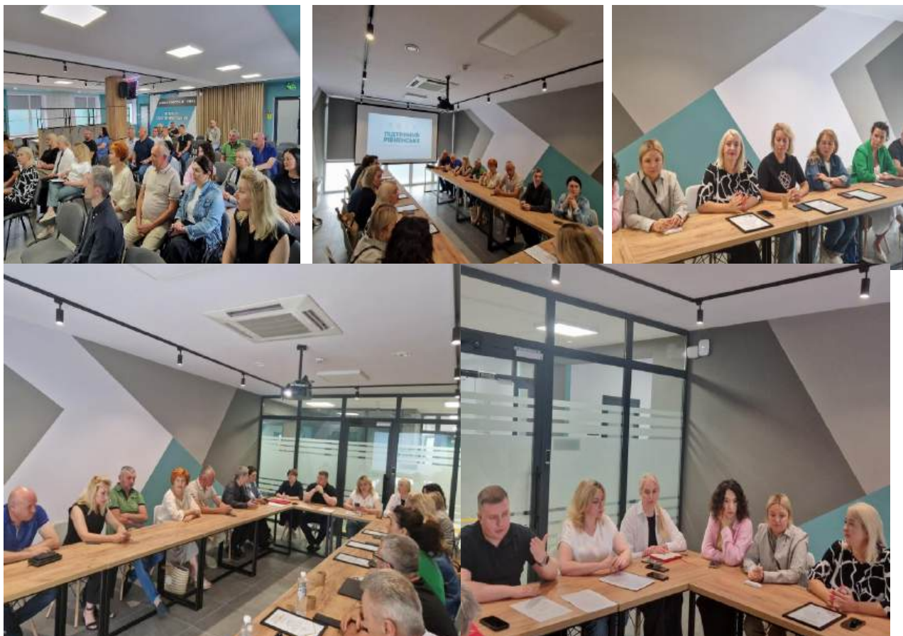
Фото3* Засідання Координаційної ради з питань сприяння розвитку підприємництва при Рівненському міському голові 25 липня 2025 року

проведення заходу «Rivne IT Conference», презентація фестивалю #Підтримуй Рівненське 2025.