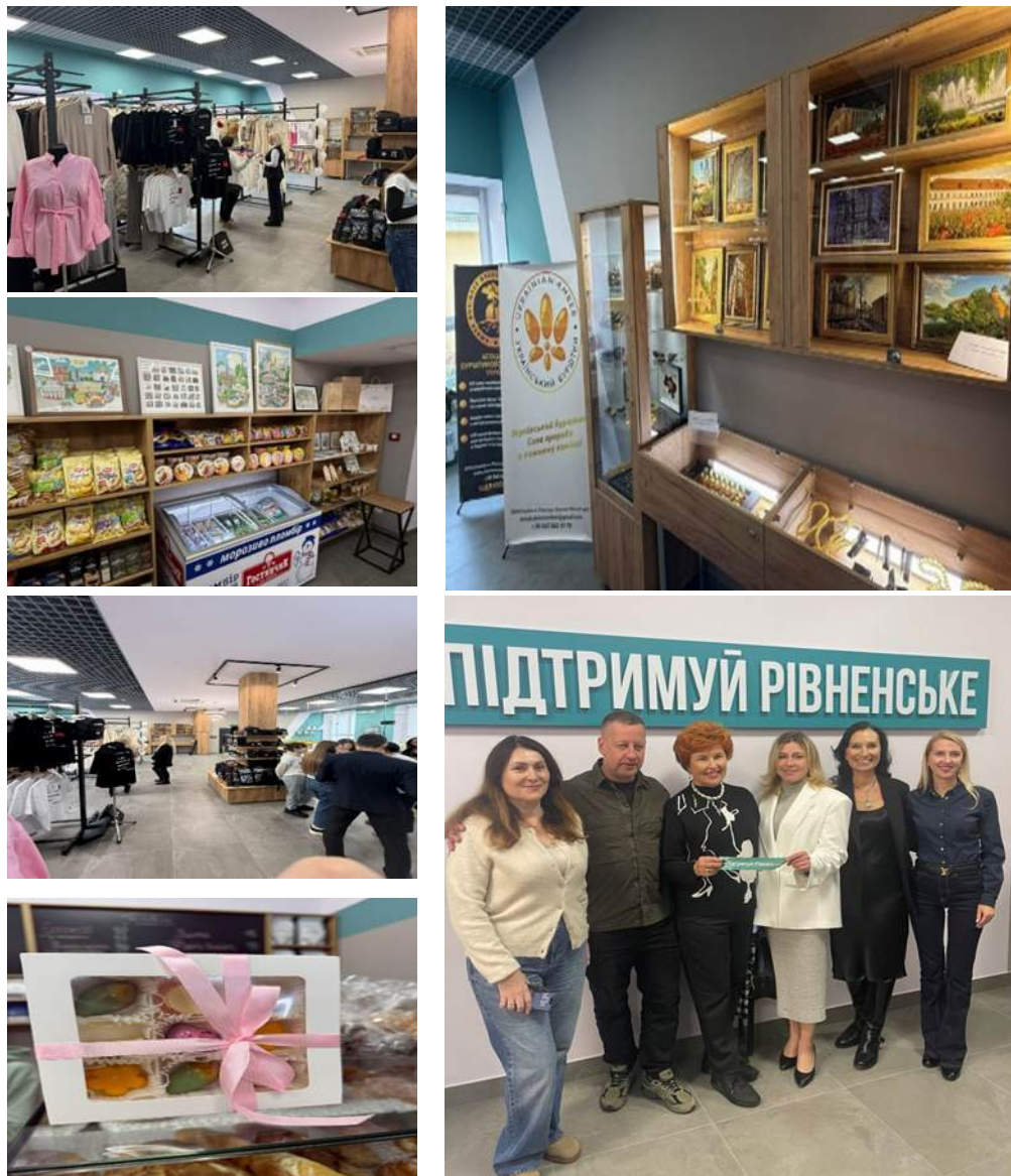
Фото 9* Відкриття майданчику «#Підтримуй Рівненське»