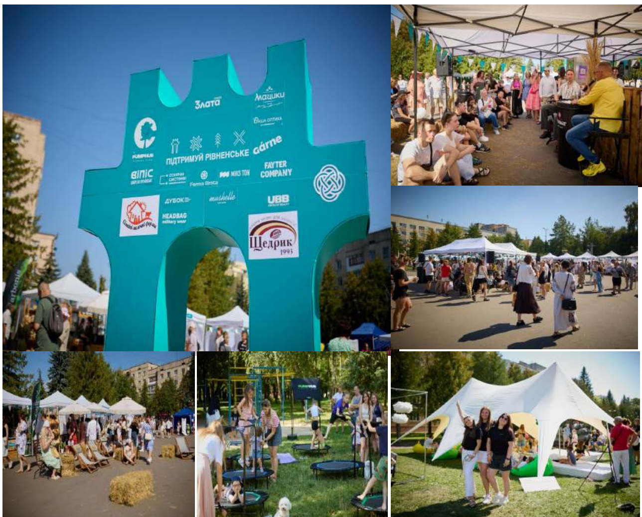
Фото2* Фестиваль #Підтримуй Рівненське у 2025 році