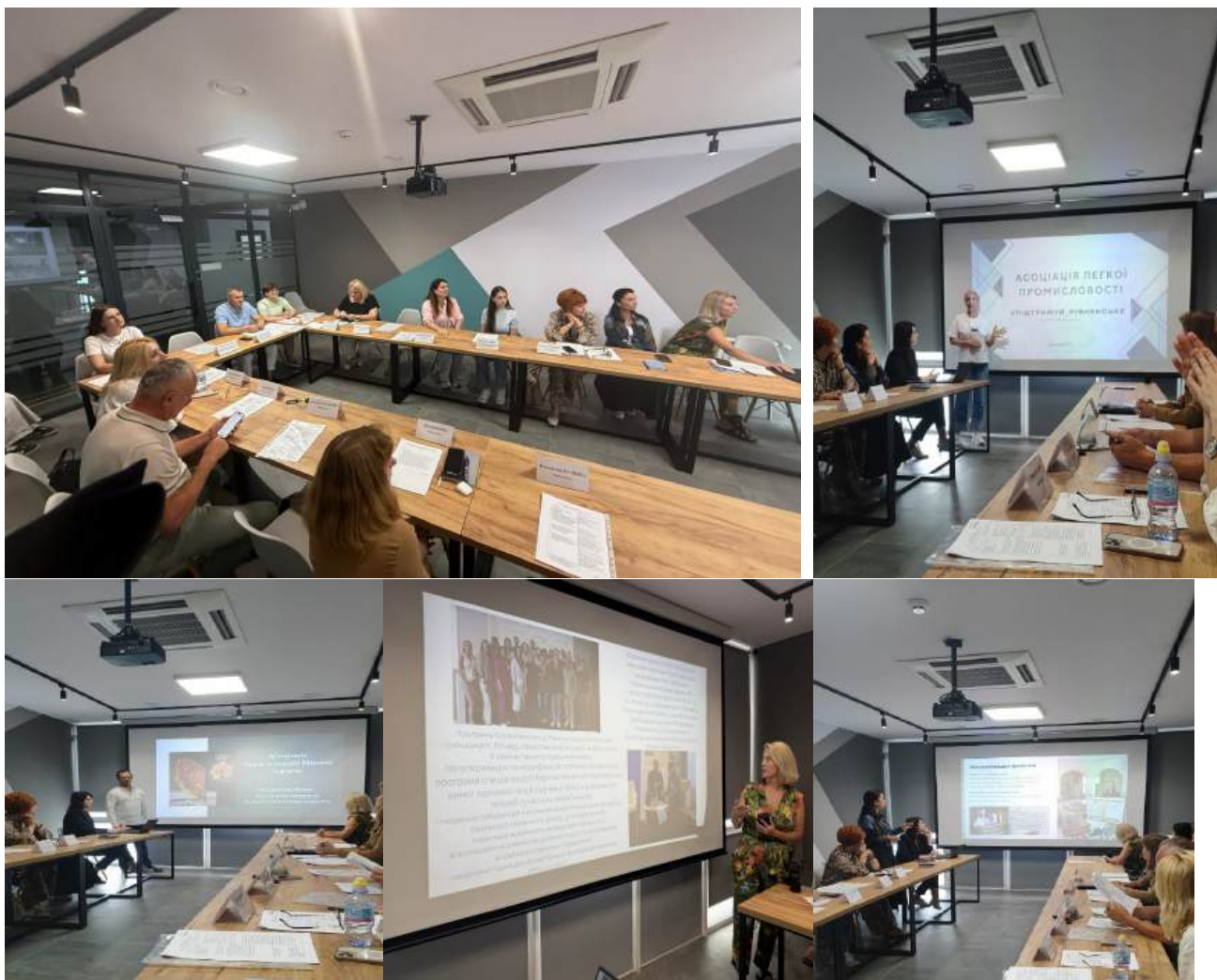
Фото 7* Засідання Конкурсної комісії з питань реалізації ініціативи #Підтримуй Рівненське в Рівненській міській територіальній громаді

Загалом у виставково-презентаційних просторах представлено продукцію 17 суб'єктів господарювання – учасників асоціацій та резидентів майданчика, що демонструє різноманітність місцевих товарів і послуг та сприяє промоції рівненських виробників.