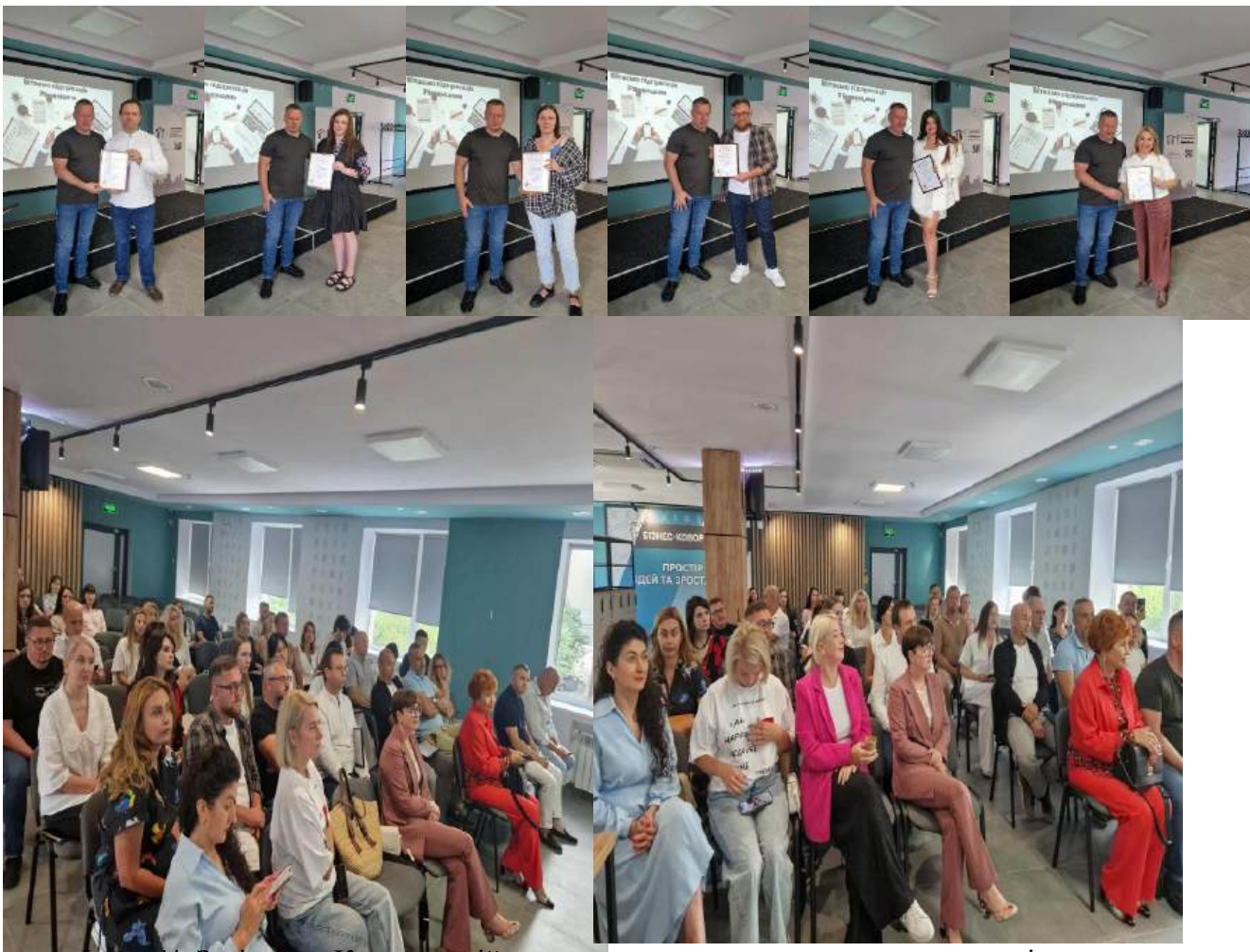
Фото 4* Засідання Координаційної ради з питань сприяння розвитку підприємництва при Рівненському міському голові 7 вересня 2025 року