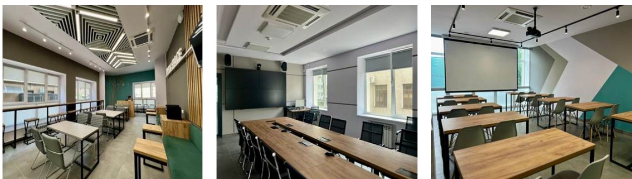
Фото 6*Приміщення простору «Бізнес-коворкінг Рівне»